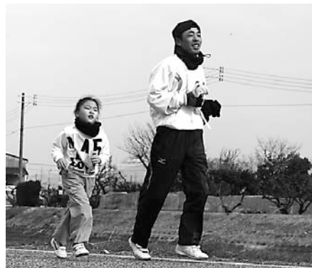
ゴールまで頑張って走ろう。(昨年の大会)

●大会で選手が負傷した場合、主催者で応急処置を行います。ただし、その後の責任は負わないものとし