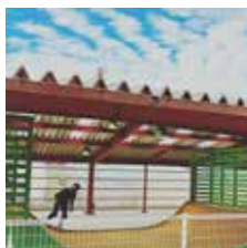
▲スケートボード練習中... 真剣に打ち込む姿はカッコいいですね~