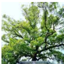
▲神社の後ろにでっかい木が! 圧倒的ですね...