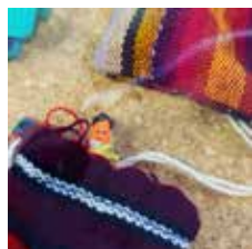
▲コンニチハ! グアテマラの織物からひよこっとなってきました

田原本町公式Instagramの10・11月の投稿から、広報担当者イチ押しの写真を紹介します。