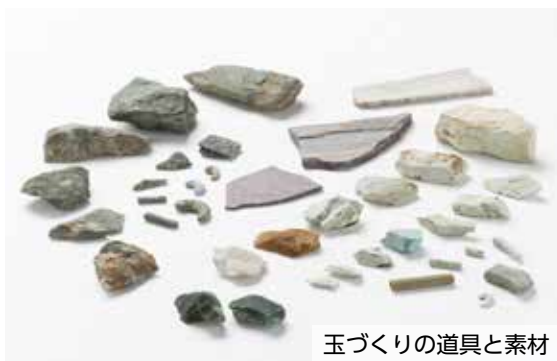
玉づくりの道具と素材