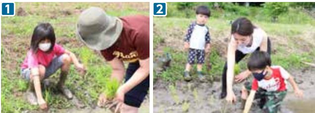
1234 水田に入ると…思ったより足を取られてびっくり! 子どもも大人も、普段なかなかできない体験を楽しんでいました