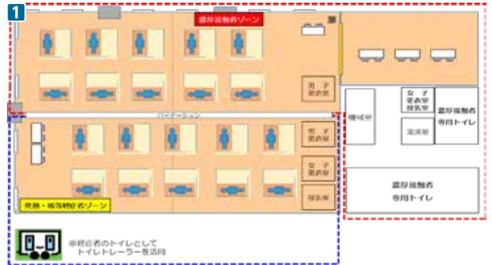
① 避難所レイアウトの一例（濃厚接触者などの避難所）。パーティション設置や、養生テープ貼り付け・間仕切りなどでの居住スペース区画分けによる避難者同士の間隔確保など、さまざまな方法で感染防止を図ります