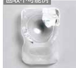
アルミシール残りあり