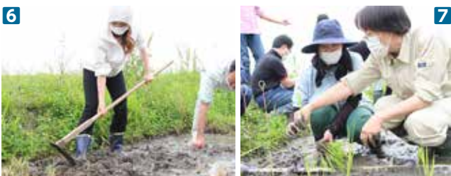
6789 学生など有志が集い、現代とは違う人力によるやり方に悪戦苦闘しながらも苗を植えていきました