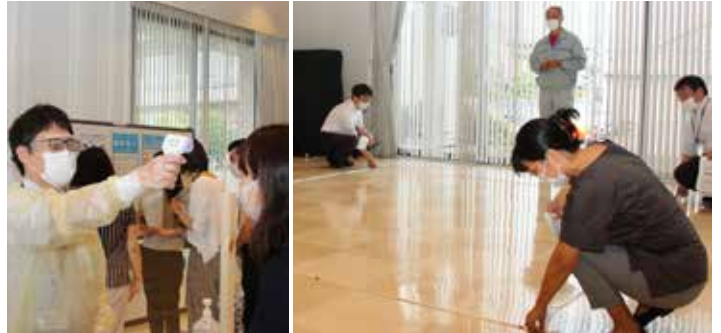
②③ 令和2年7月の訓練では、コロナ禍に応じた、避難所での居住スペース区画表示や検温・問診などの受付対応などが行われました