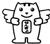
明るい選挙のイメージキャラクター 選挙のめいすいくん