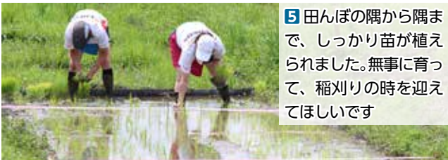
5 田んぼの隅から隅まで、しっかり苗が植えられました。無事に育って、稲刈りの時を迎えてほしいです