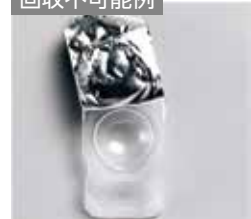
アルミシール残りあり