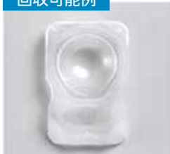
アルミシール、レンズの残りが無く空ケースのみの状態