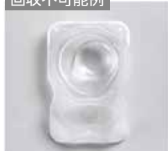
レンズが残っている