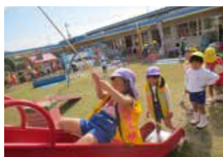
全身を使って忍者修行に挑戦するよ！