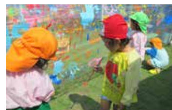
魚がいっぱい！海の中にもぐっているみたいだね！