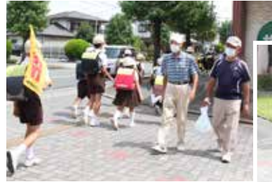
ながら見守り活動の様子