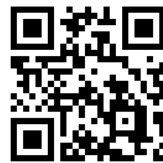
◀マイナポータルはこちら