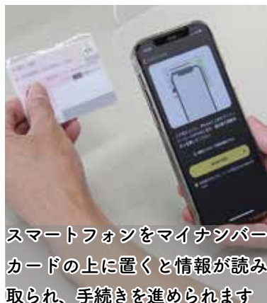
スマートフォンをマイナンバーカードの上に置くと情報が読み取られ、手続きを進められます

※田原本町におけるオンラインでの行政手続きは、児童手当に関する申請など一部対応しています。詳しくは「マイナポータル」を確認いただくか、担当課にお問い合わせください。