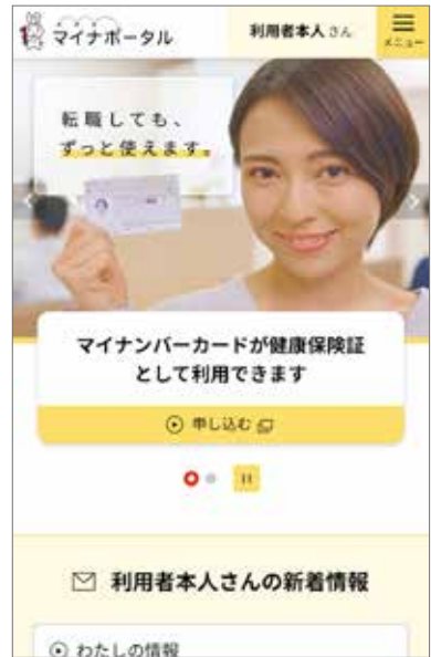
▲マイナポータルのトップ画面。一部サービスは利用者登録が必要になります