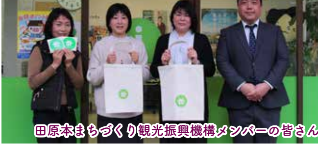
田原本まちづくり観光振興機構メンバーの皆さん

コロナ禍の中、1つ1つ、私たちにできることを…このまちを盛り上げていくため、全力で取り組んでいきます！