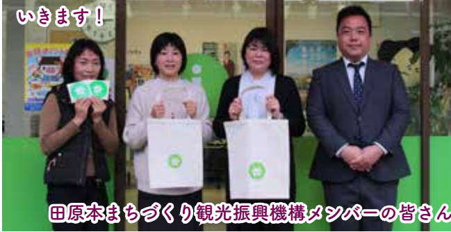
田原本まちづくり観光振興機構メンバーの皆さん

コロナ禍の中、1つ1つ、私たちにできることを…このまちを盛り上げていくため、全力で取り組んでいきます！