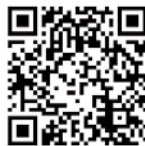
▲ YouTube たまかんチャンネル