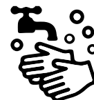
石けんによる 手洗い