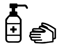
手指消毒用アルコール による消毒の励行