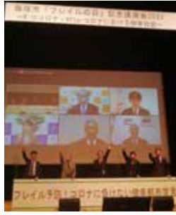
▲田原本町をはじめ全国8市町で健幸都市宣言を行いました

コロナ禍の中で、飯塚市をはじめ参加自治体の「知恵を絞って事業を進め、住民の皆さんの健康を守る」という強い意思を感じ、ヘルスケアプロジェクトなど「健幸」への取り組みが全国規模で着実に進んでいることを実感しています。