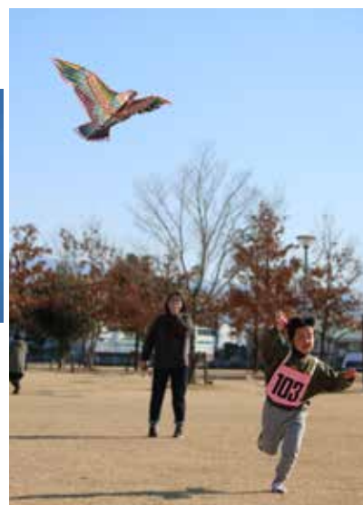
▲力いっぱい走って風を揚げる