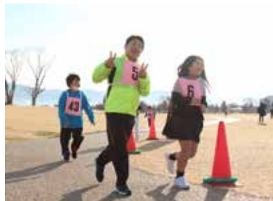
▲▶ジョギング大会の様子。1周960mの周回コースを皆で楽しく、力いっぱい走っていました

雲一つない快晴の中、参加された人たちは広大な史跡公園を気持ちよく周回されていました。