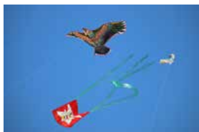
▲さまざまな凧が空を舞う

参加者は公園内を元気いっぱい走り回りながら、自慢の凧を上手に風に乗せ風揚げを楽しみました。