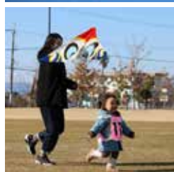
◀親子で風揚げを楽しむ