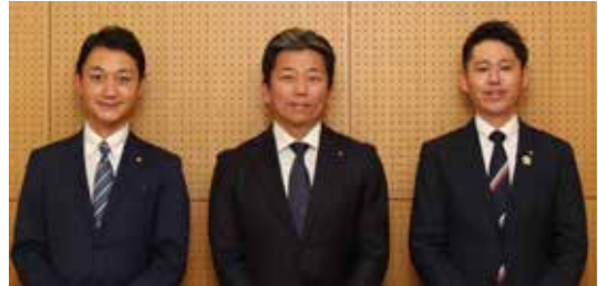
磯城郡水道企業団企業長