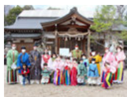
万葉衣装に身を包んだ子どもたち。古の時代を体験していました

田原本町公式Instagramの4・5月の投稿から、広報担当者イチ押しの写真を紹介します。