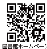
図書館ホームページ