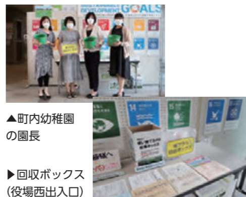
▲町内幼稚園の園長

町では令和2年8月から使用済み歯ブラシの収集を行っています。収集した歯ブラシを植木鉢などに交換できる事業に参加しており、歯ブラシ10本（約1本）が2ポイントとなります。8月末時点で住民の皆さんのご協力により、歯ブラシの収集量が約7267本となりました。