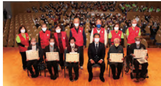
第2回 いきいき百歳元気交流大会の様子

今一度、体操の効果を実感していただけるように講演会と90歳以上の体操継続者に対し表彰式を行います。皆さんのご参加をお待ちしています。