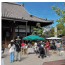
▲浄照寺で行われたマチテラスクエア、多くの人々が訪れました