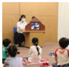
▲楽しいおはなしに夢中になる子どもたち