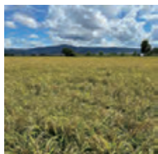
▲実りの秋、黄金色の稲穂が一面に広がります

田原本町公式 Instagram の 8・9 月の投稿から、広報担当者イチ押しの写真を紹介します。