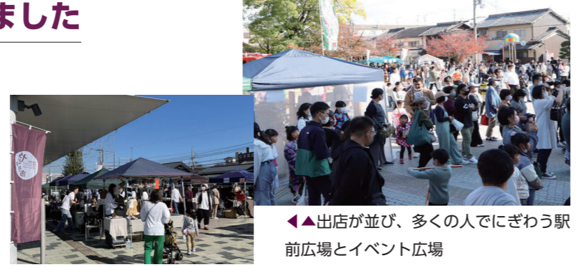
◀▲出店が並び、多くの人でにぎわう駅前広場とイベント広場

田原本駅前活性化プロジェクト「やどかり市」が開催されました。駅前広場では手作りマルシェ、イベント広場ではフードエリアが設置されました。また、ステージではステージパフォーマンスとして能楽ステージや新企画の「フレッシュフェスタ」が行われ、会場は大勢の人でにぎわっていました。