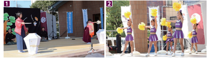
1 能を舞う子どもたち 2 フレッシュフェスタでチアダンスなどを披露