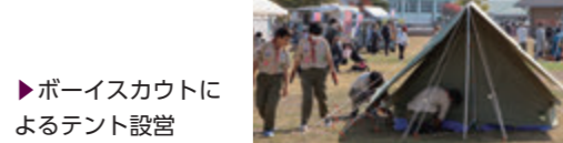
▶ボーイスカウトによるテント設営

奈良トヨタグループ・田原本町共催のアウトドア&防災フェスティバルが唐古・鍵遺跡史跡公園で開催されました。 会場では災害時に活躍する車両の展示やボーイスカウト・自衛隊によるテントの設営などが行われ、来場者は防災への意識を高めました。