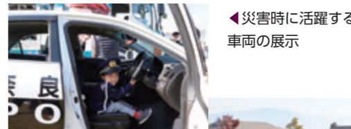
◀災害時に活躍する車両の展示