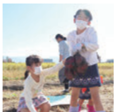
▲親子で農業体験! 一所懸命にお芋掘りを楽しみました