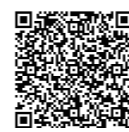
▲町内委託医療 機関について