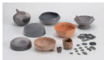
◀溝にささげられた滑石製 祭祀具と土器（保津・宮古 遺跡第22次調査 5世紀）

観覧料 ▶一般…200円（常設展との共通券300円） ▶高校・大学生…100円（常設展との共通券150円）