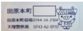
見守りシール(アイロンシール)