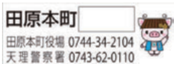
見守りシール(反射シール)