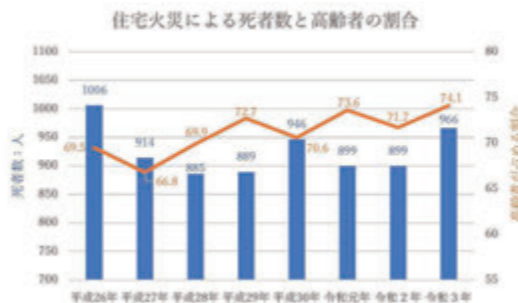
図 磯城消防署予防課 ☎ 33-2461

調理中にコンロの火が衣服に燃え移ることで発生する火事などもあります。火が燃え移らないように、枕や布団などの寝具、パジャマやエプロンなどは燃えにくく作られた「防災品」を使用することをおすすめします。