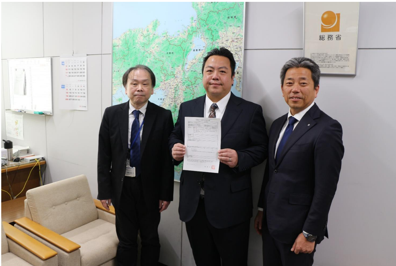
「総務省 近畿総合通信局」

本局は、田原本町が施設・設備を整備し、機構が運営を担う「公設民営型コミュニティFM」で、この方式によるコミュニティFM局の開局は近畿で初となります。（コミュニティFMの開局は、奈良県内で5局目）