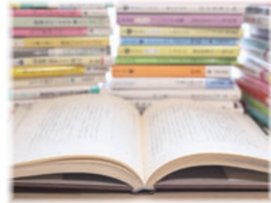
地域包括ケア病棟 デイルーム

わいわいタイム 毎週水曜日：午前9時30分～午後5時 毎週日曜日：午後1時～5時 問い合わせ ☎ 32-0262