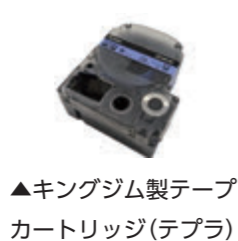
▲キングジム製テープカートリッジ（テプラ）

令和5年7月からリサイクルを目的として使用済みテープカートリッジ（テプラ）と使用済みペン（筆記具）を収集しています。これらをそのまま「もえるごみ」で出していないですか？捨てずにリサイクルすることで、テープカートリッジの部品や新しい筆記具などに生まれ変わり、資源として活用させることができます。