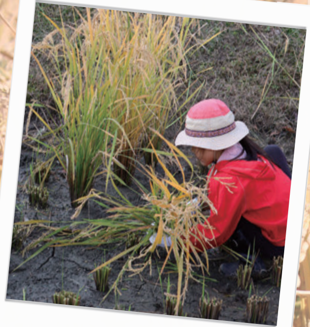
#たくさん刈れました