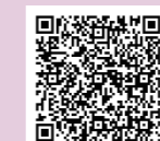
新型コロナワクチンの有効性・安全性について

接種後に起こる可能性のある症状（副反応）、新型コロナワクチンに関するQ & Aについては、厚生労働省のホームページをご参照いただくか、コールセンターにお問い合わせください。