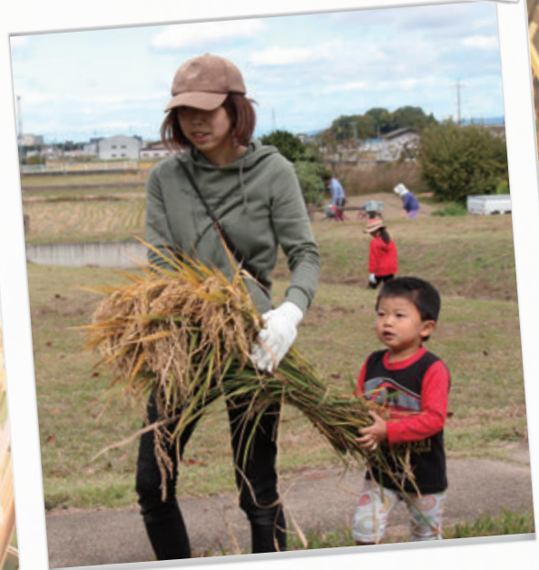
#重かったけど運べたよ！