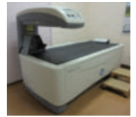
DXA法(二重エネルギーX線吸収法)の機器

定や血液検査、尿検査などで行います。まず、骨密度測定ですが、当院では特に正確な診断であるDXA法(二重エネルギーX線吸収法)の機器を備えており、通常の単純X線検査と同様に、受診日(初診日)に撮影診断することができます。