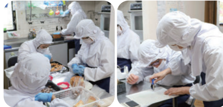
授産品のお菓子の包装作業（どっとゆう） 利用者同士で協力して楽しく作業しています