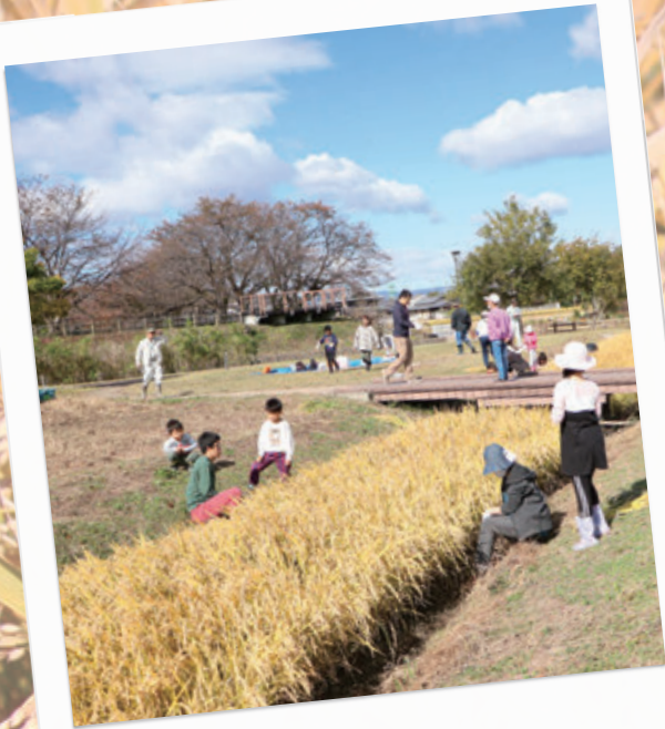
# Let's 稲刈り！