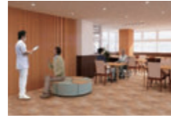
地域包括ケア病棟 デイルーム

近々、骨粗しょう症・ロコモ外来を開設する予定です。まずは外来で骨粗しょう症の検査を行ってみることをお勧めいたします。