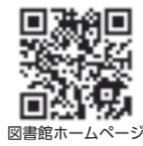
図書館ホームページ