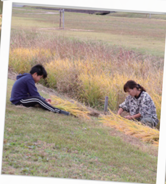
#協力して稲を束ねます