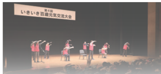
多くの人々が参加した「いきいき百歳元気交流大会」