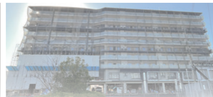
田原本駅南地区市街地再開発ビル（令和5年12月10日時点）