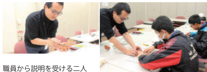
職員から説明を受ける二人