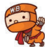
あつた丸忍者 あつた丸

★町役場本庁舎では、暖房を室温19℃に設定し、職員は室温に適した服装で仕事をしています。