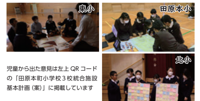
児童から出た意見は左上QRコードの「田原本町小学校3校統合施設基本計画(案)」に掲載しています