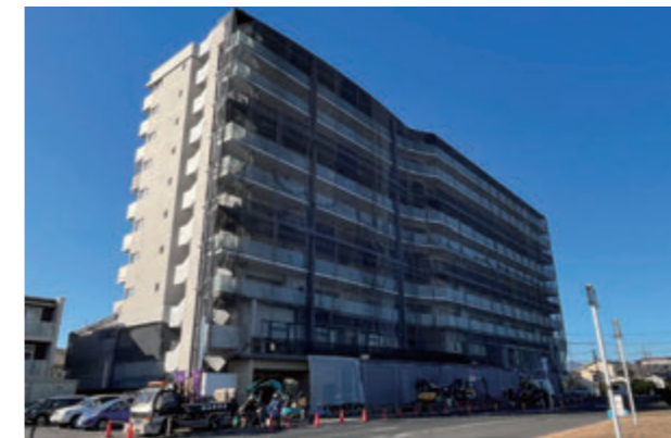
駅前再開発ビル「トモルテたわらもと」