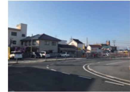
再開発ビル建築工事前の様子

「賑わいある中心市街地の拠点づくり」を図るとともに「田原本町に住み続けたい人、新たな居住者に向けた街なか居住モデルとなる住宅の供給」を目的とした駅前再開発ビル「トモルテたわらもと」がオープンします。