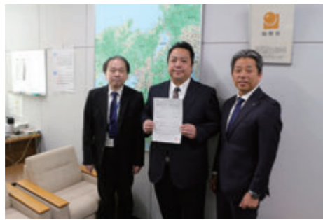
令和5年12月21日「総務省 近畿総合通信局」にて

(一社) 田原本まちづくり観光振興機構は、総務省近畿総合通信局から昨年12月21日に無線局予備免許通知書の交付を受けました。本局「FMまほろば」は、田原本町が施設・設備を整備し、機構が運営を担う「公設民営型コミュニティFM」で、この方式によるコミュニティFM局の開局は近畿で初となります(コミュニティFMの開局は県内で5局目)。4月1日(予定)の開局後は、田原本町をはじめとする周辺地域の情報や、防災・災害情報など生活に寄り添ったラジオ局を目指します。