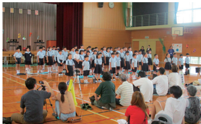
▶ 全学年による校内音楽会の様子

第 2 回…10 月 23 日(水)午前 9 時 30 分～ 10 時 30 分