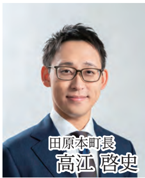
田原本町長 高江 啓史