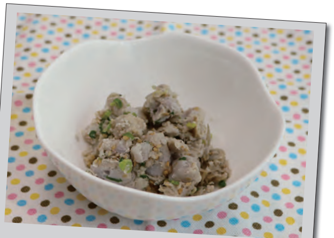
味間いも（里いも）のじゃこバター和え

また、高血圧の原因となる食塩（ナトリウム）を体外へ排出する作用があるカリウムを多く含んでおり、血圧を下げる効果があると言われています。