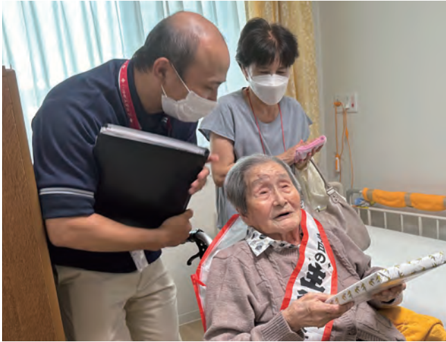
最高齢おめでとうございます