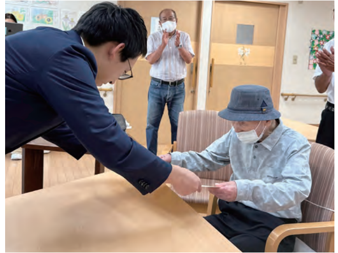
100歳おめでとうございます