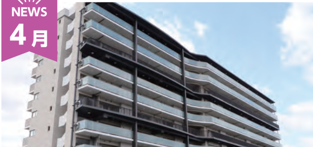
トモルテたわらもとオープン

FM まほろば、こどもはぐくみ・交流センター、こどもまんなか保育園の運営が開始されました。