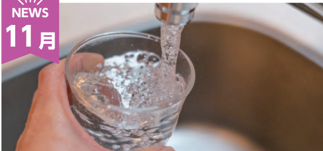
奈良県広域水道企業団の設立が許可・設立

磯城郡水道事業団に代わり、令和 7 年 4 月 1 日から県広域水道企業団として事業を開始します。