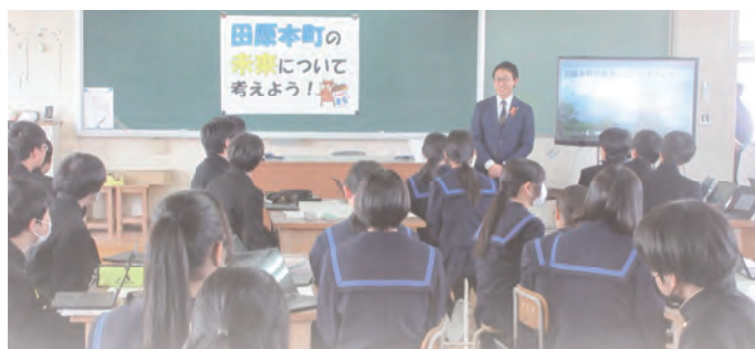
北中学生との対話