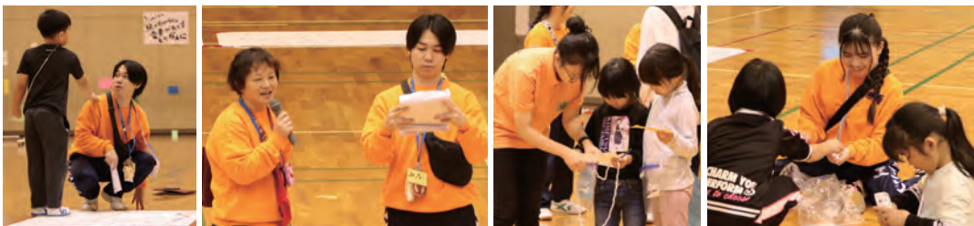
写真 上段：子どもカーニバル終了後の集合写真 中段：準備風景 下段：当日の様子

高校生以上のシニアリーダーと中学生のジュニアリーダー計33人で活動しています。曾爾高原宿泊体験学習の指導や、子どもカーニバルの企画運営、小学校への出前行事などの活動を行っています。リーダーの人数、行事のクオリティ全てが県下一です。 子どもと本気で向き合って、全力で遊んでいます！