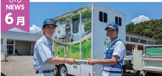
トイレトレーラーの撤収

能登半島地震を受けて能登町へ派遣していたトイレトレーラーが、約半年の派遣を終え撤収しました。