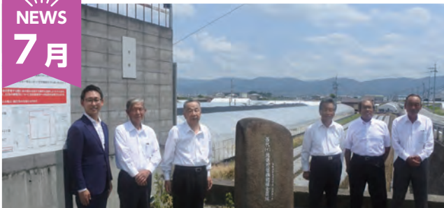
全国初！貯留機能保全区域として指定

西代地区の農地約 11.6ha が貯留機能保全区域に指定されました。土地利用対策として全国初の指定です。