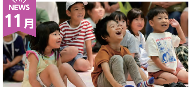
青垣生涯学習センター開館 20 周年

開館 20 周年を記念して、声優朗読劇や絵本ライブなどさまざまなイベントが開催されました。