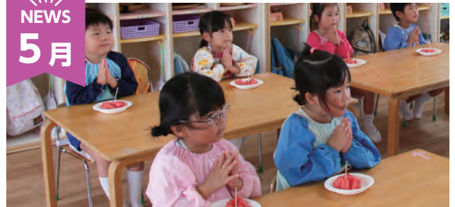
こども まるごと GoTo プロジェクト