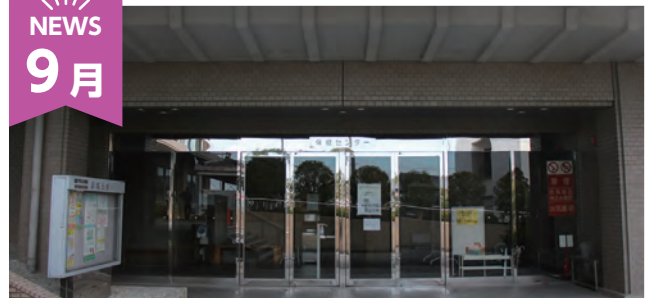
保健センター移転・こども家庭センター開設

役場内と保健センターに分かれていた相談窓口が 1 つになり、子どもに関する支援体制が強化されました。