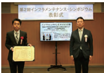
橋梁包括的発注の制度構築について、第7回インフラメンテナンス大賞（国土交通省）にて優秀賞を受賞しました

橋梁については、5年毎に点検を行い、修繕計画を策定し、修繕を行っています。また、橋梁の複雑な構造により補修難易度が高いことに対して、独自の施工方式（ECI方式、複数年包括的発注方式）で修繕に取り組むことで、令和6年度に事後保全対策が完了します。