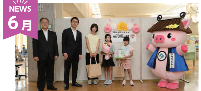
図書館来館者 700 万人達成

田原本町に図書館ができてからの来館者が 700 万人を超えたことを記念し、セレモニーを開催しました。