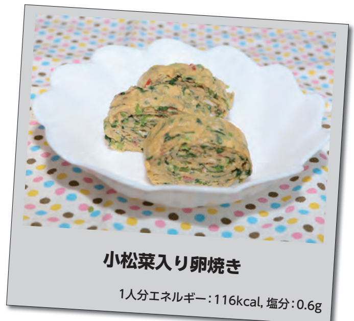
小松菜入り卵焼き

カルシウムは、骨を構成する重要な栄養素です。カルシウムが不足すると骨が十分に成長せず、骨折の原因となる骨粗しょう症になりやすくなるので、食事にカルシウムを多く含む食品を積極的に取り入れることで予防することが出来ます。カルシウムは乳製品や骨ごと食べられる小魚、豆腐や納豆などの大豆製品、野菜（小松菜やチンゲン菜など）などに多く含まれています。これらの食品を偏ることなく複数組み合わせることで、バランスのとれた食事にもつながります。