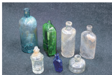
保津・宮古遺跡 第57次調査出土 ガラス瓶