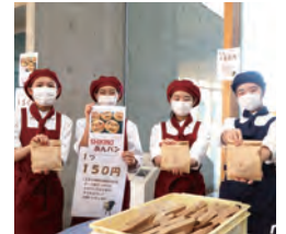
▲「磯城野高等学校×青垣生涯学習センター」