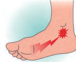
③ 足根管症候群（脛骨神経）