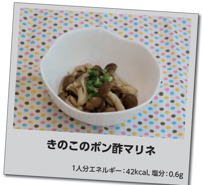
きのこのポン酢マリネ

また、便通をよくし、便秘を予防する効果もあります。日頃の食生活では不足することが多いので、積極的にとるようにしましょう。