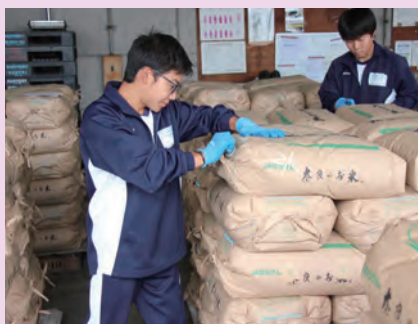
川東営農経済センター