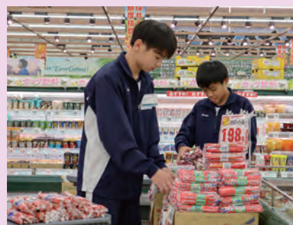
スーパーエバグリーン 田原本店