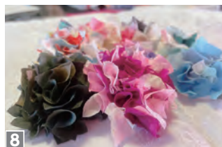
1 (写真左から) 代表 永田瑞穂さん、スタッフ 岸上昌美さん 2 和 (なら・たわらもと花水木) 3・4 保護者向けお茶会 5 しめなわ作り 6 「ピアノの先祖」ハンマーダルシマー演奏体験 7 飾り巻き寿司作り 8 着物でリメイクお花作り