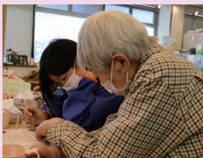
介護老人保健施設 サンライフ田原本