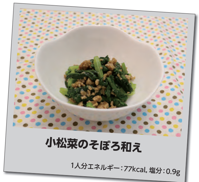
小松菜のそぼろ和え

ビタミンCやカロテンなどの栄養素が増し、糖分が増えて甘みも増すため、おいしく食べることができます。