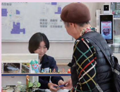
ふれあいセンター