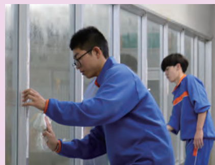
スポーツセンター田原本