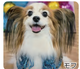
モフ 我が家の癒し