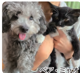
ベア・ミヤオ 仲良しな 2 人