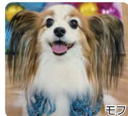
モフ 我が家の癒し