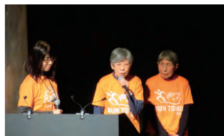
認知症になっても参加継続できるように、認知症の人をサポートする「チームオレンジ」の活動紹介