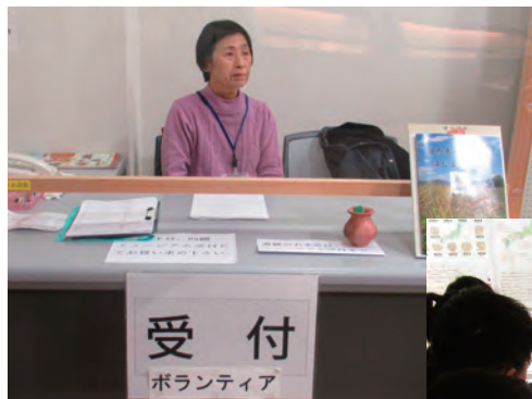
唐古・鍵考古学ミュージアムでのボランティア活動の様子