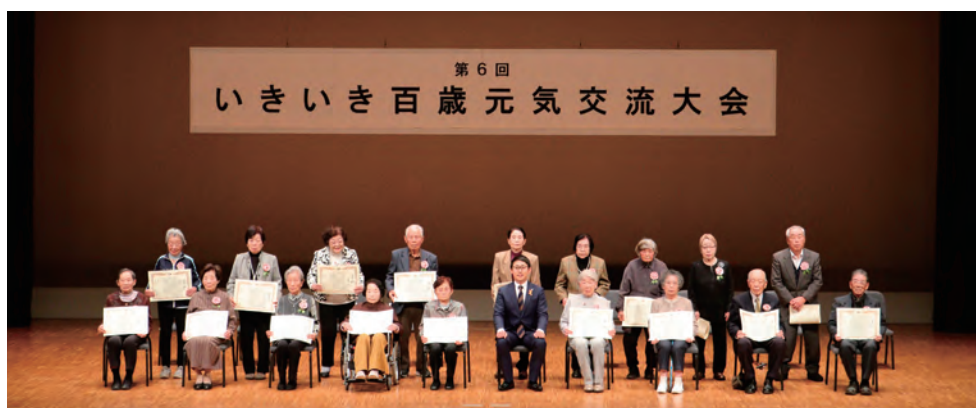
いきいき百歳体操を継続している90歳以上の18人が表彰式に出席されました。受賞された皆さんはとても凛としていました。

体を鍛えられ、仲間も増えると好評なこの体操を通して、参加者の声や取り組みを紹介します。