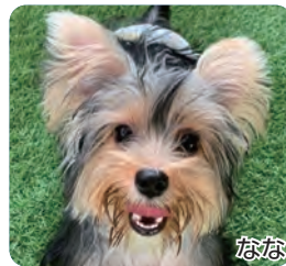
なな やんちゃ坊主!