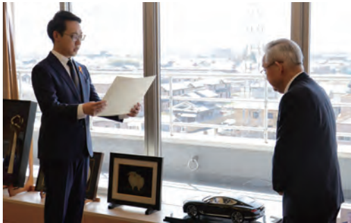
寄附に対して感謝状が贈られる

南部環境開発(株)が紺綬褒章を受章され、高江町長と辻本町長（大淀町）から褒状が手渡されました。