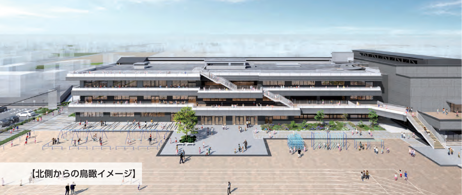
【北側からの鳥瞰イメージ】