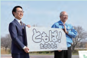
仁淀鉄鋼(株)から園名の看板プレートが寄贈されました