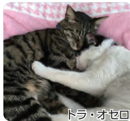
トラ・オセロ いつも仲良し