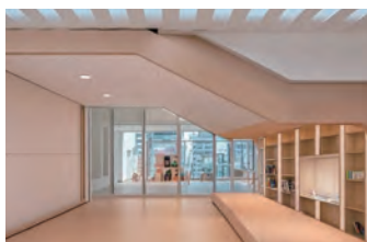
1 階大階段下のデザイン (デザイン要素)