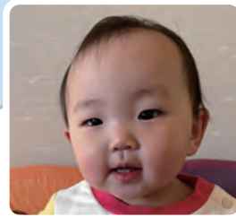
名 そりり なぎ 曽路里 柳ちゃん