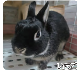
いちご ごはん大好き！