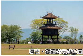
唐古・鍵遺跡史跡公園