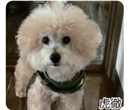
とりに 腰痛持ちの老犬です★