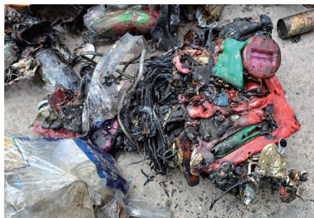
発火原因と考えられるごみ