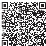
日本年金機構 個人の方の電子申請(国民年金)