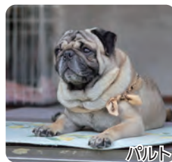
パルト 気が優しい甘えん坊