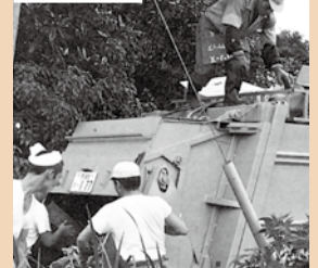
町内全域の塵芥収集開始