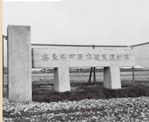
健民運動場（県下第1号）完成