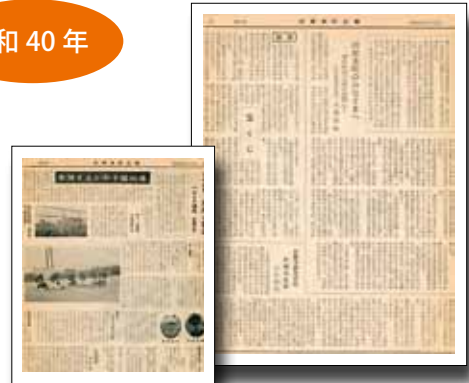
▲広報たわらもと（昭和40年1月号・5月号）

とは、日頃の汗にまみれた真面目な練習のたまものであり、選手の人生においても最大の出来事でありました。また、田原本町の名誉ともなったのです。」とつづられ、郷土代表校を町をあげて応援していた様子が伺えます。