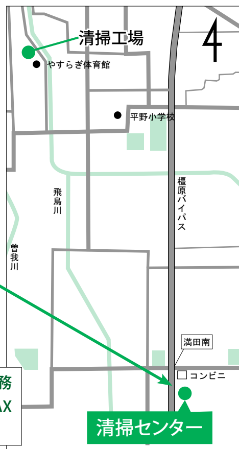
清掃センターの位置図