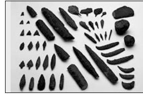
▲さまざまな打製石器

弥生時代の人々は、身近に存在する石や遠隔地から運ばれてきた貴重な石の適材を理解し、砥石や石斧、石剣など生活に必要な道具へと作り変えました。 今回の企画展では、当時の人々の知識と技術に注目し、唐古・鍵遺跡から出土したさまざまな石器を展示します。