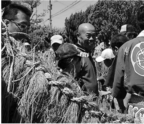
▲道中、人々を綱で巻いて祝う

5月5日、矢部で豊作を祈願する祭り「綱かけ」が行われ、一同が綱を担いで伊勢音頭に合わせて村中を練り歩きました。道中、慶事のあった家、自治会役員宅、当屋宅などに綱を持ち込んで祝い、家の人を綱で巻いていきました。