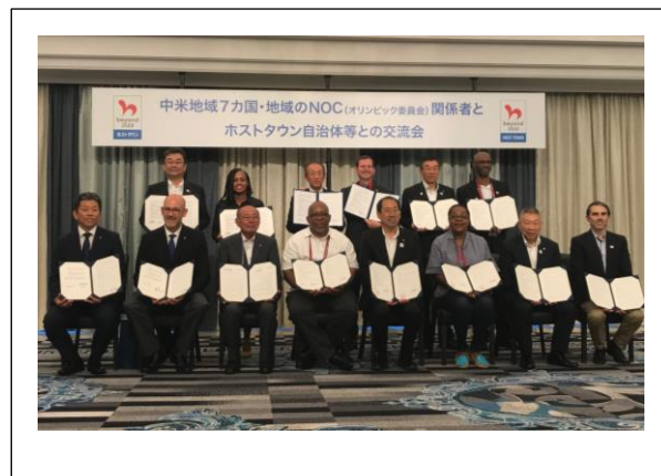
8/22 東京 2020 オリンピック・パラリンピック 中米 8 カ国地域合同調印式の様子