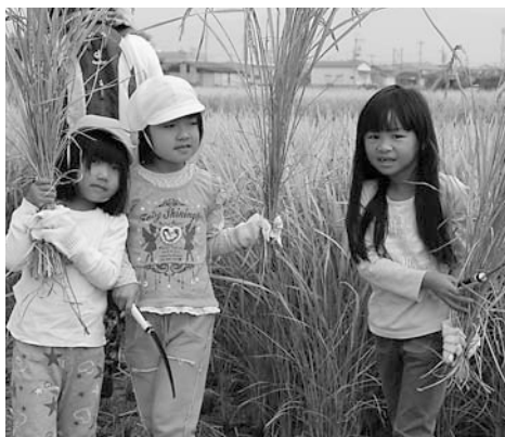
▲刈り取った稲を持ち笑顔みせる

10月24日、多で美しい多地区の田園風景を楽しむ会が主催する「第3回「やすまるさん米」稲刈り体験」が行われ、150人が参加しました。この会は、都市と農村の交流を通して多地域の自然・景観を生かした美しいむらづくり、地域の活性化を図ることを目的に活動しています。参加者たちは、力いっぱい稲刈りをした後、新米を使ったおにぎりを食べて地域の魅力を感じました。