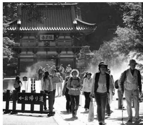
▲景色を楽しみながら勝尾寺を歩く

10月18日に「第96回歩こう会」が開催され、154人が参加しました。今回の歩こう会は勝尾寺拝観と箕面の滝を訪れ、約6キロを散策しました。勝尾寺駐車場を出発した参加者たちは、勝尾寺を拝観し、箕面ビクターセンターで昼食を取りました。その後、参加者たちは箕面大滝や龍安寺を巡り、秋の爽やかな日差しのもと自然を満喫しました。