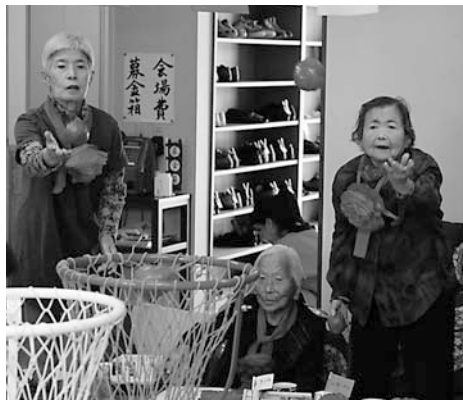
▲一生懸命に玉を投げ入れる

10月14日、コミュニティホールで高齢者や障がいのある人を対象に活動する活き粋サロンふれあいコスモスが「畳の上大運動会」を行いました。これは懐かしい運動会を思い出しながら体を動かし、心身ともに若返ることを目的に行われています。参加した人たちは赤組と白組に分かれ、玉入れなど計6種目を競い、元気はつらつとして運動会を楽しみました。