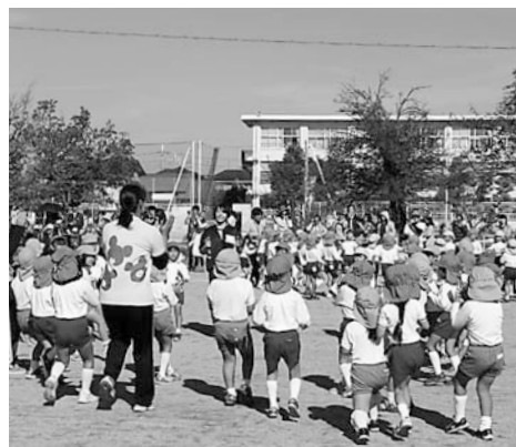
▲全園児が参加してダンスを踊る

11月5日、田原本幼稚園で「第29回町内幼稚園年長児交流運動会」が行われました。これは、他園の園児と交流することで、新たな出会いや普段できない体験をすることを目的としています。園児たちは、大玉転がしや綱引きなどを力いっぱい頑張りました。また、全園児が参加してのダンスでは、他園の園児と直接ふれあい、楽しめました。