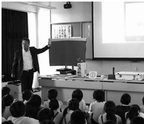
▲スマートフォンの危険性について説明

10月20日、南小学校の5年生を対象に「情報モラル学習会」が行われ、NHKの情報番組「ならナビ」に取り上げられました。この学習会は県と警察によって開かれたもので、ネットを使った犯罪に巻き込まれないため、スマートフォンの危険性と正しい使い方を学ぶことを目的としています。児童たちは、真剣な表情で話を聞き、防犯意識を高めました。