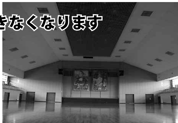
▲現在の中央体育館アリーナ