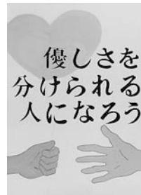
▲田原本中学校 3 年