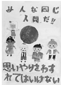
▲平野小学校 4 年