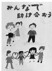
▲平野小学校 4 年

なお、すべての応募作品(ポスター)は「差別をなくす町民集会」の会場に掲示します。