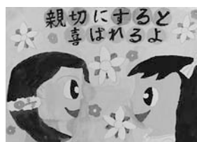
▲北小学校 6 年