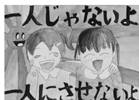
▲田原本小 5 年